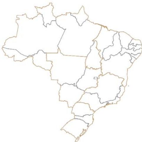
Mapa 1 – Brasil, Grandes Regiões e Unidades da Federação

Exemplo de disposição e identificação das ilustrações, quadros, figuras, imagens e outros.